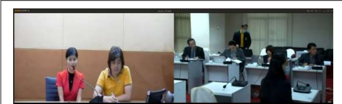
สัมภาษณ์ศิษย์เก่า