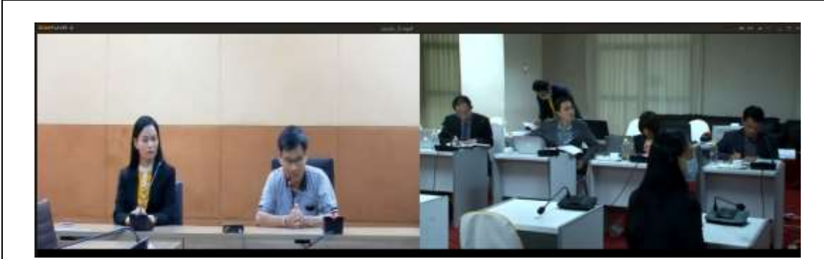
สัมภาษณ์ผู้ใช้บัณฑิต