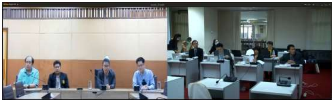
สัมภาษณ์อาจารย์ประจำ นักวิจัย และบุคลากรสายสนับสนุน