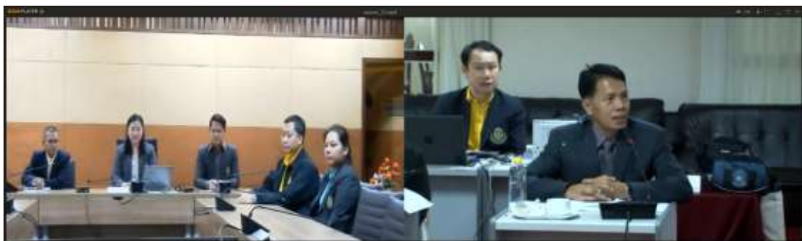
สัมภาษณ์ผู้บริหาร