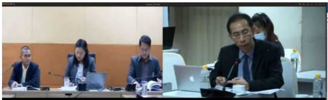
สัมภาษณ์ผู้รับผิดชอบตัวบ่งชี้ที่ 1-6