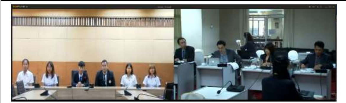
สัมภาษณ์นักศึกษาปัจจุบัน