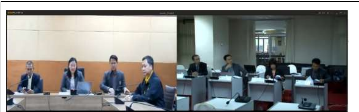
ผู้บริหารวิทยาลัยแม่ฮ่องสอนกล่าวต้อนรับคณะกรรมการประเมิน และนำเสนอผลการดำเนินงาน