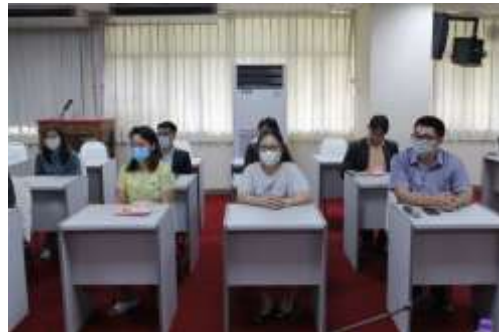
คณะกรรมการดำเนินการการสัมภาษณ์