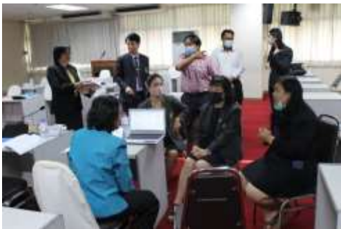
คณะกรรมการดำเนินการการสัมภาษณ์