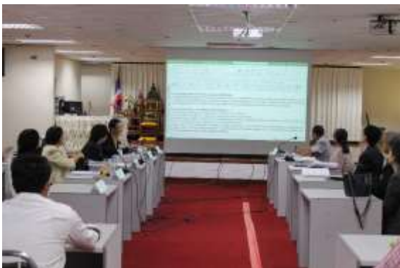
คณะกรรมการรายงานผลการประเมิน