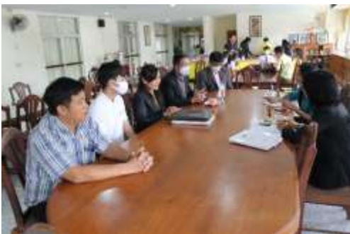
คณะกรรมการดำเนินการการสัมภาษณ์