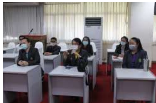
คณะกรรมการดำเนินการการสัมภาษณ์