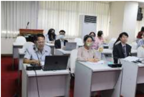
คณบดีกล่าวต้อนรับ