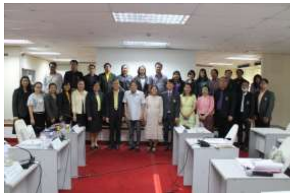
ผู้บริหารและคณะกรรมการบันทึกภาพร่วมกัน