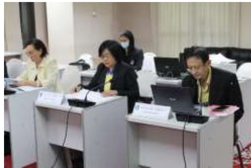
คณะกรรมการกล่าววัตถุประสงค์การตรวจเยี่ยม